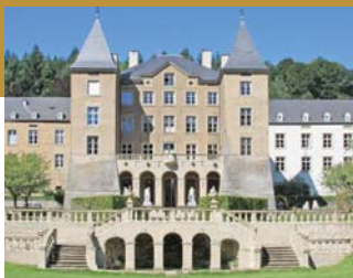
Grand-Château d'Ansembourg 10, rue de la Vallée L- 7411 Ansembourg www.gcansembourg.eu